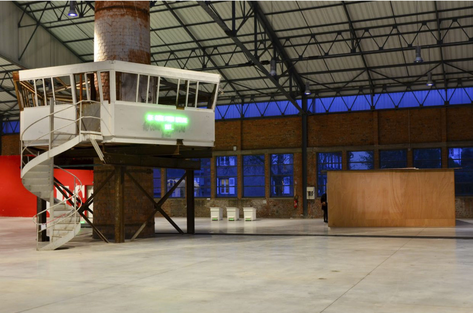
vue d'exposition à la Halle Verrière - Meisenthal