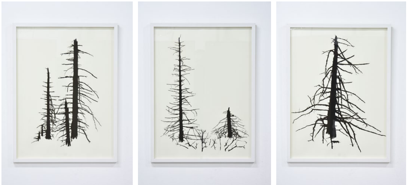
SPRUCES 1 - 2 - 3 - serie étude - 2010 - 60x80x2 - gouache sur papier