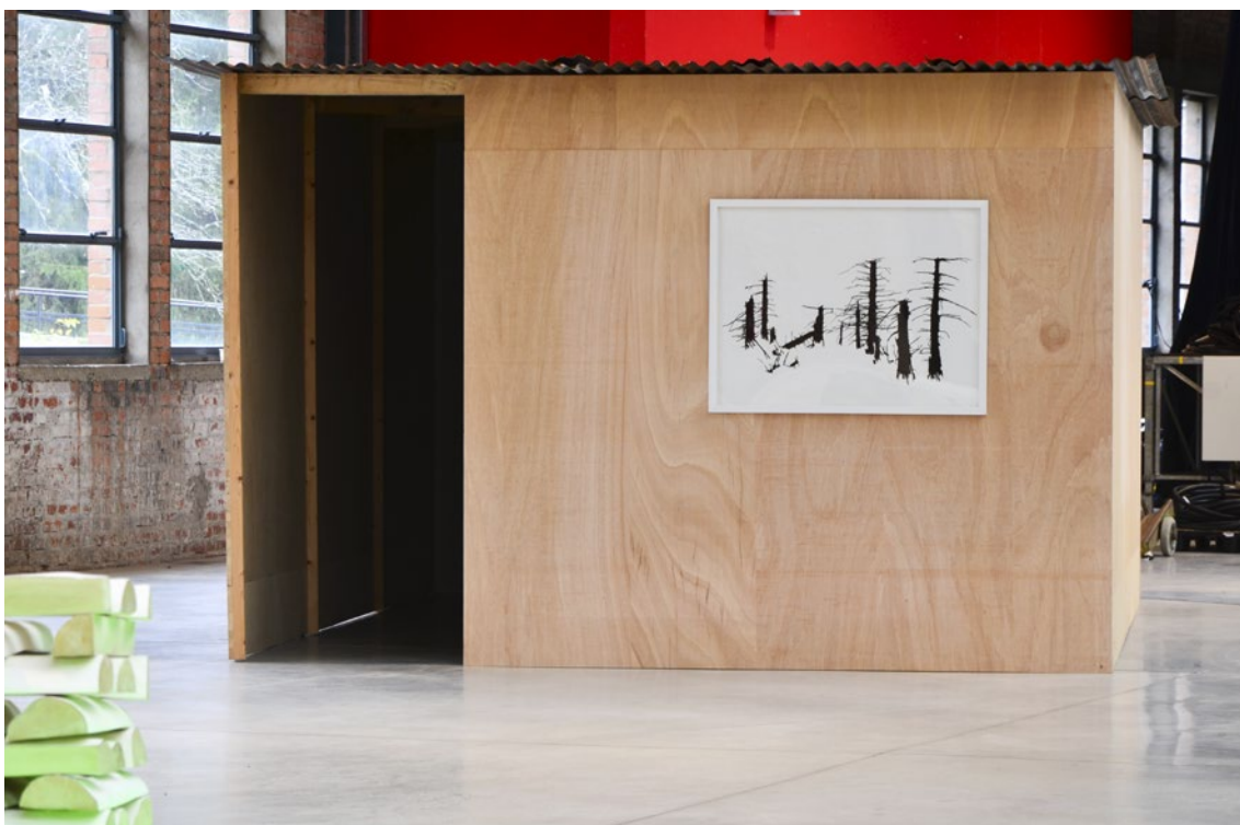
vue d'exposition à la Halle Verrière - Meisenthal