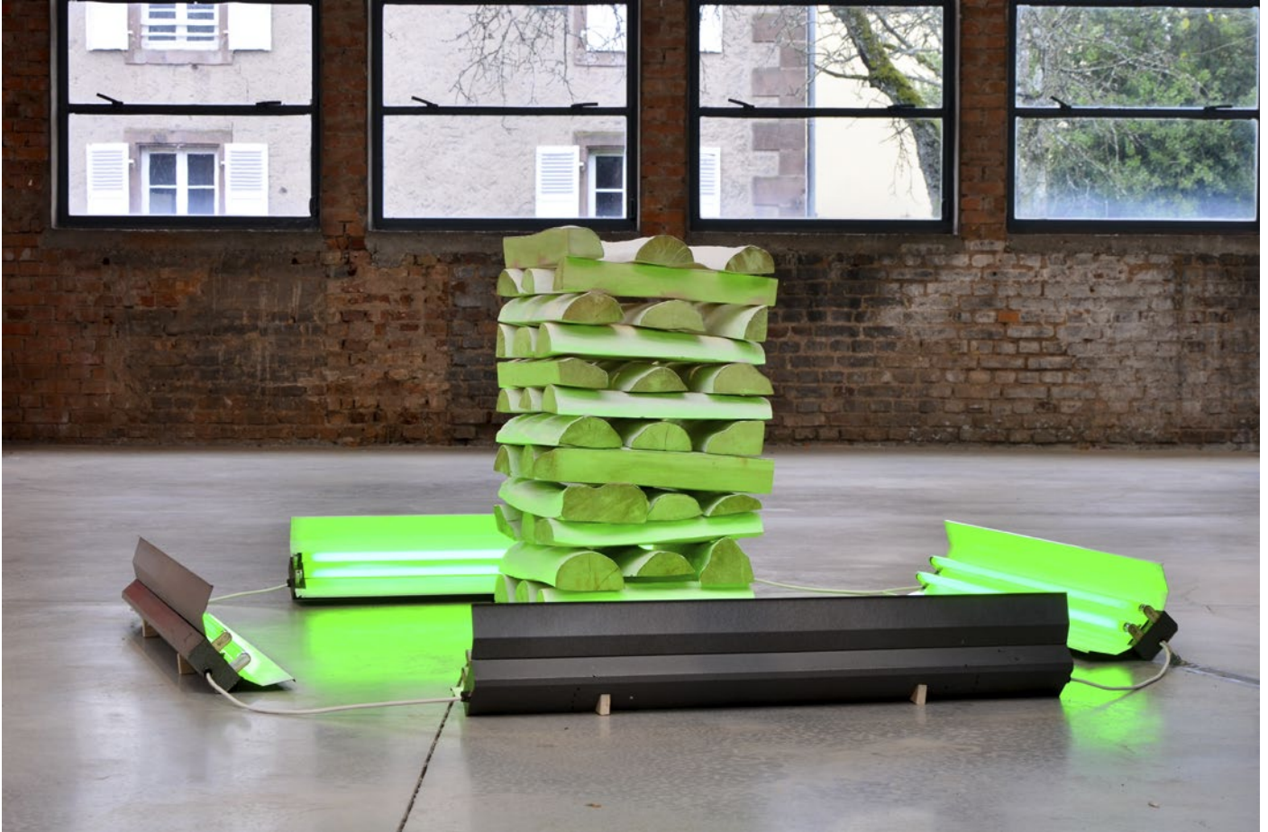
vue d'exposition à la Halle Verrière - Meisenthal