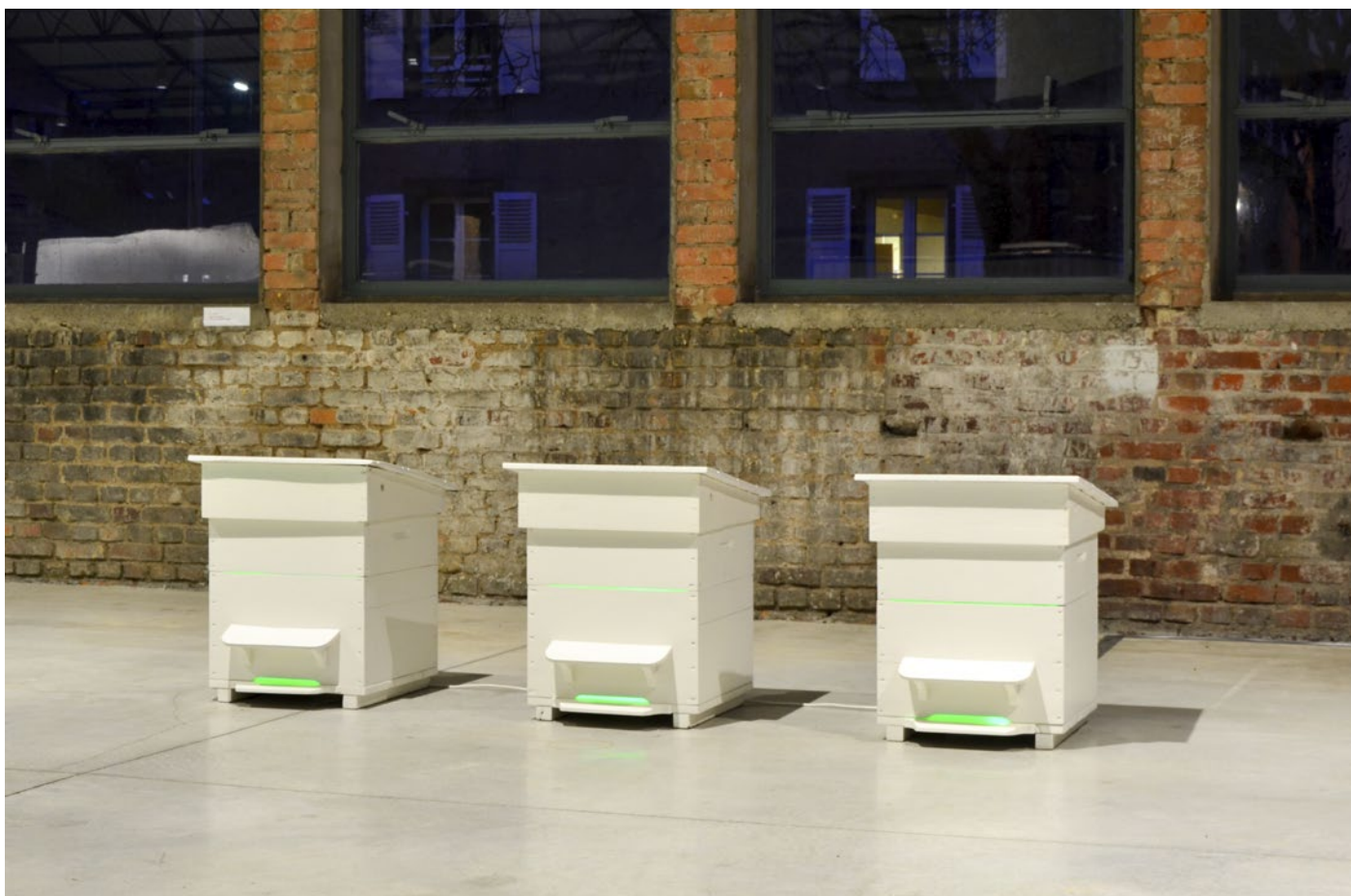
vue d'exposition à la Halle Verrière - Meisenthal