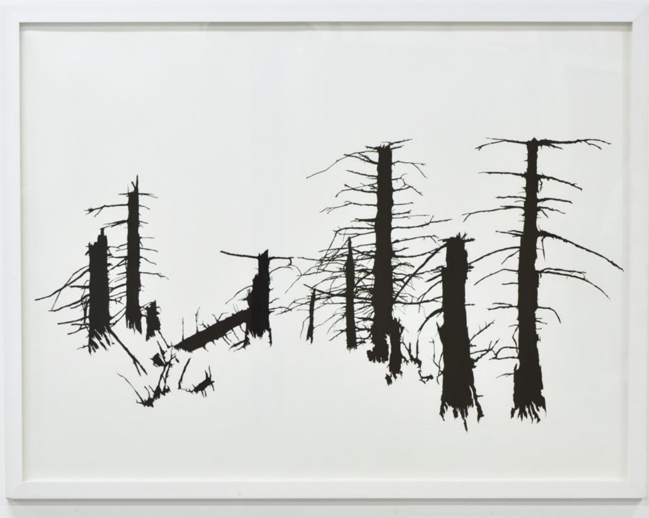
SPRUCES V - 2010 -100x70cm - acrylique sur papier