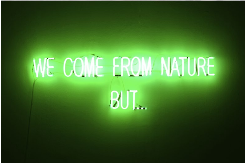
vue d'exposition à la Halle Verrière - Meisenthal