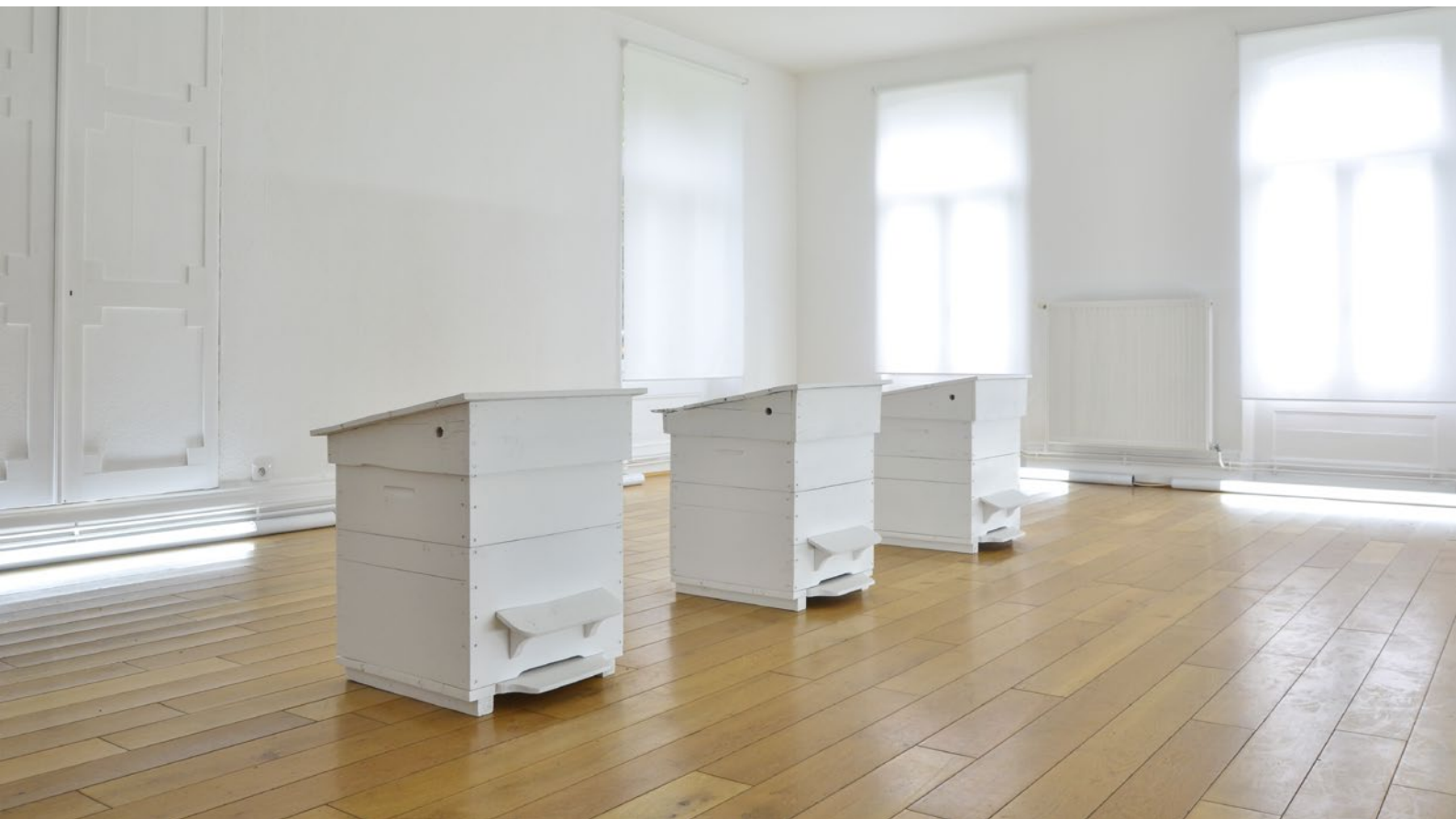
vue d'exposition maison du bocage - Avesnois